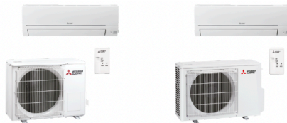
WSH-HR35W 1 x MSZ-HR35 VF 1 x MAC-587 IF (ACTIE) 1 x MUZ-HR35 VF