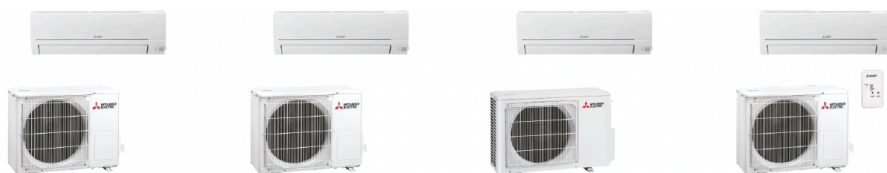
WSH-HR25I SET 1 x MSZ-HR25 VF 1 x MUZ-HR25 VF