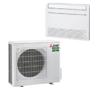
VSH-M50I SET 1 x MFZ-KT50 VG 1 x SUZ-M50 VA