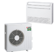
VSH-M60I SET 1 x MFZ-KT60 VG 1 x SUZ-M60 VA