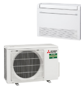
VSH-M35I SET 1 x MFZ-KT35 VG 1 x SUZ-M35 VA